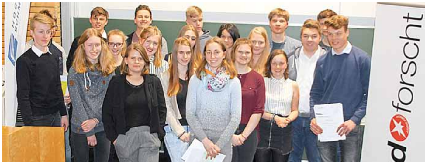
Das Team des von-Bülow-Gymnasiums überzeugte die Jury. Der Preis für die erfolgreichste Schule Südwestthüringens ging ohne zu zögern nach Neudietendorf – verbunden mit 1.000 Euro zur weiteren Förderung von Jugend-Forscht-Arbeiten.