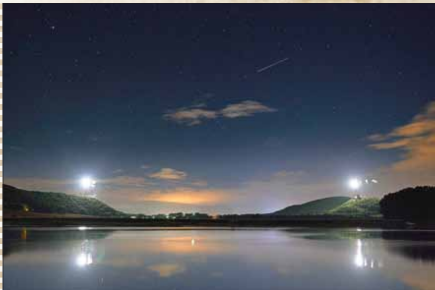
„Der große See“ - 2. Platz - vergeben an Herrn Maximilian Heller aus Ilmenau