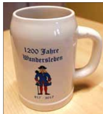
Bierkrug für 10,00 €

Informationen zur Fahne: Größe: 1400 x 900 mm, klassisches Fahnenmaterial, schwer entflammbar (B1), ringsum gesäumt, an der Schmalsite (oben) mit Hohlraum für Stabdurchmesser 28 mm