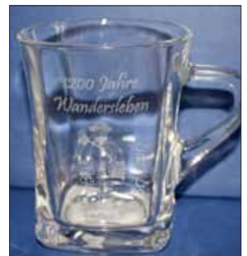
Trinkglas mit Gravur für 10,00 €