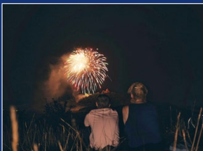
„Das Junge Foto“