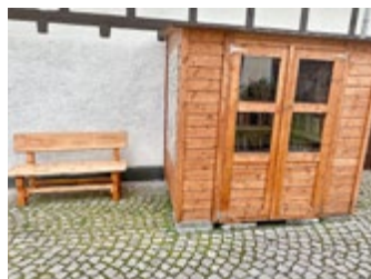
Fertigstellung und Eröffnung unserer Bücherhütte

Lassen Sie mich hier einen kurzen Rückblick auf das vergangene Jahr machen: