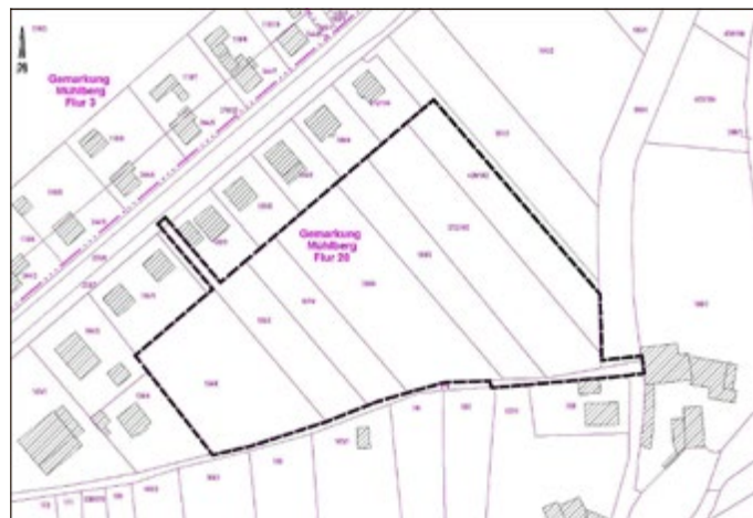
Geltungsbereich der 1. Änderung des Bebauungsplanes der Gemeinde Drei Gleichen für das Allgemeine Wohngebiet (WA) „Auf der Pferdekoppel“ im Ortsteil Mühlberg