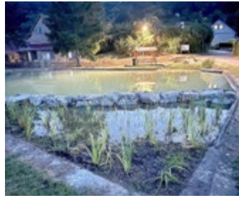
Fertigstellung Baumaßnahme „Angerteich“