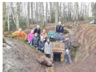
Instandsetzung/Zuwegung „Gesundbrunnen auf dem Seeberg“