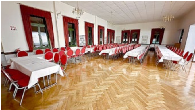
Neue Bestuhlung Saal und Versammlungsraum Gemeindegalerie

Nun liegt das Jahr 2024 vor uns. Die Herausforderungen sind enorm und in Anbetracht der aktuellen Entwicklungen würden manche sagen: Es gibt noch kein Licht am Ende des Tunnels. Nein wir schauen trotzdem auf ein weiteres Jahr voller Hoffnungen und mit vielen Wünschen und guten Vorsätzen.