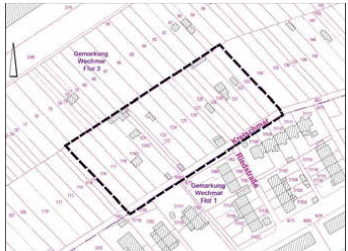
Gemeinde Drei Gleichen - Übersichtslageplan zum Geltungsbereich des Bebauungsplanes

Diese Bekanntmachung samt Übersichtslageplan erfolgt im Amtsblatt der Gemeinde Drei Gleichen, Drei-Gleichen-Bote Nr. 01/2026 am 17.01.2026 und gilt mit diesem Tag als öffentlich bekannt gegeben.