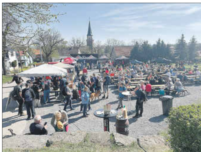
Wanderer in Seeborgen auf dem Anger