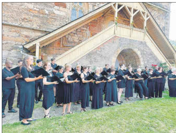
MDR-Chor vor der Kirche