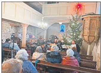
Adventsmarkt in Cobstadt

Daran schloss sich der, von Cobstädter Einwohnern organisierte, Cobstädter Adventsmarkt am zweiten Advent an. Nach der den Adventsmarkt eröffnenden musikalischen Andacht in der Cobstädter „Martin Luther Kirche“, lud der davor befindliche Schulplatz mit seinem festlich geschmückten Christbaum und den Weihnachtsständen zum Bummeln als auch Verweilen ein.