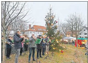
Hoffest im Advent in Grabsleben

Am dritten Advent fand dann in Grabsleben das vom Ortschaftsrat Cobstadt/Grabsleben/Großbrettbach für alle drei Orte ausgerichtete Hoffest im Advent mit seinem Weihnachtsmarkt und natürlich auch dem Weihnachtsmann statt, welches vom Mühlberger Posaunenchor und dem Musiker Jan Sadowski mit weihnachtlichen Klängen umrahmt wurde. Zu dem gelungenen Nachmittagsprogramm auf der Naturbühne trug auch wieder eine Aufführung des Kindergartens „Walnuss-Zwerge“ aus Grabsleben bei.