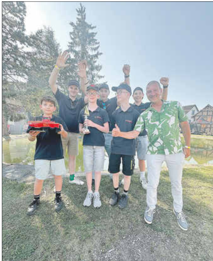
Gewinner „Ängerteich-Regatta“, Partnergemeinde Oberboihingen