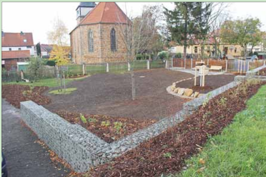
Platzgestaltung Anger im OT Grabsleben, 1. BA

Lesen Sie dazu mehr auf den Innenseiten dieser Ausgabe.