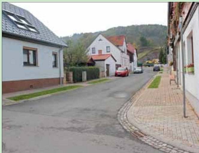
Sanierung der Gustav-Leutelt-Straße (Foto) und der Straße des Aufbaus im OT Seebergen