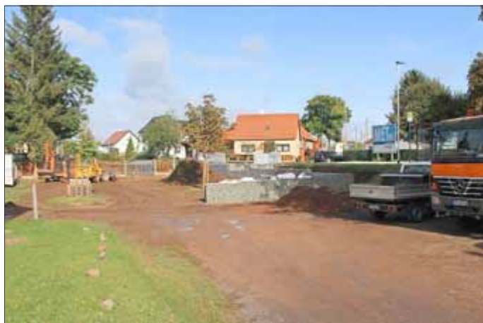
Aufnahme während der Bauarbeiten

Anfang November konnte im OT Grabsleben der 1. Bauabschnitt zur Gestaltung des Angers beendet werden. Dieser 1. Bauabschnitt ist die erste Maßnahme, die wir im Rahmen der Dorferneuerung in unseren Ortsteilen Cobstädt, Grabsleben und Großrettbach umsetzen konnten.