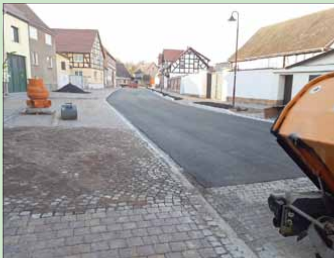
Sanierung der Ernst-Thälmann-Straße im OT Mühlberg, 2. BA,

In den letzten Tagen konnten verschiedene Baumaßnahmen im Gemeindegebiet fertig gestellt werden.