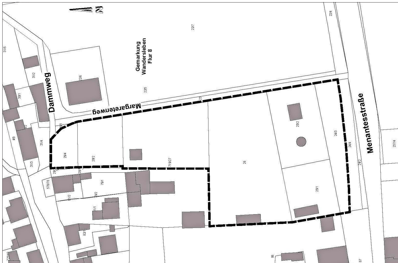
Gemeinde Drei Gleichen - Übersichtsplan zum Geltungsbereich des Bebauungsplans für das Wohngebiet „Margaretenweg“ im OT Wandersleben