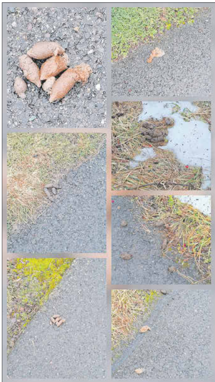
Verschmutzung durch Hundekot