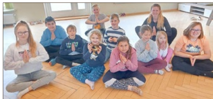
gez. J. Kornhaas Jugendsozialarbeiterin Gemeinde Drei Gleichen

Statt dem Fahrstuhl lieber die Treppe benutzen oder häufiger Fahrrad fahren und nicht mit dem Auto, waren nur einige Tipps, die wir gemeinsam herausfanden. Vor dem Mittagessen machten wir uns noch auf zu einem Spaziergang durch Wandersleben. Bei unserer Zettel-Challenge mussten die Kinder verschiedene Sachen (beispielsweise ein grünes Haus oder die Hausnummer 178) finden und so erkundeten wir Wandersleben und brachten eine weitere Bewegungseinheit in den Tag. Am Nachmittag folgte eine Apfelverkostung und wer wollte, konnte noch einmal das Zucker-Farb-Experiment durchführen. Außerdem blieb noch etwas Zeit zum „Werwolf“ spielen oder zum Toben auf dem Hof, bevor die schönen Tage zu Ende gingen. Das Fazit der teilnehmenden Kinder war durchweg positiv und wir Jugendsozialarbeiterinnen bedanken uns an dieser Stelle bei den Kindern und ihren Eltern für diese ereignisreiche Woche.