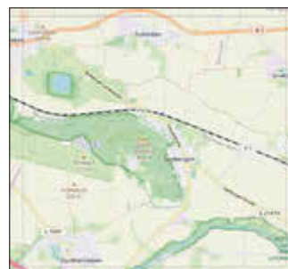
Karte des Beobachtungsgebietes

Das Gebiet rund um den Seeberg bietet mit seinen Wiesen, Gewässern und Gehölzen besonders gute Voraussetzungen für spannende Entdeckungen.