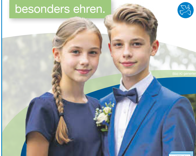
Bild KI generiert

Anzeige online aufgeben unter wittich.de/jugendweihe