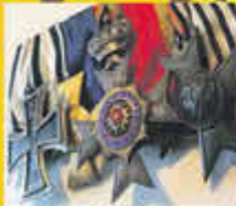
Militär und Orden