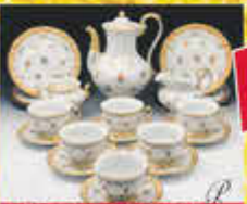
Porzellan Haushalt Bestecker