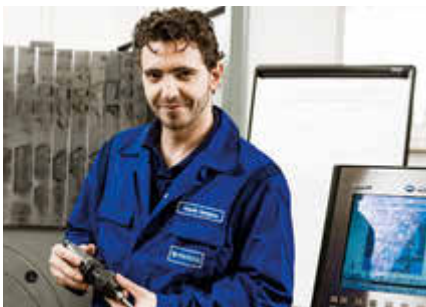
Werkzeugmechaniker/in (gn) Leidenschaft fürs technische Detail