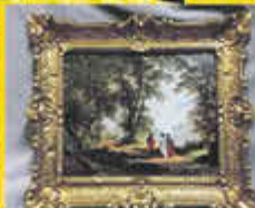
Gemälde aller Art