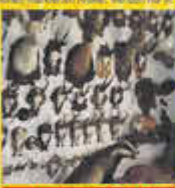
Tierpräparate aller Art