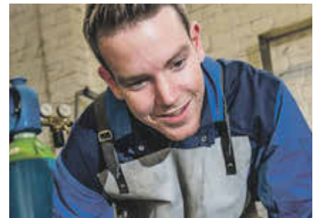
Elektroniker/in (gn) Die Freude am handwerklichen Einsatz

Wählen Sie unter drei Berufen in einem Hightech-Unternehmen, das Qualität, Präzision und Zuverlässigkeit mit Herzblut lebt.