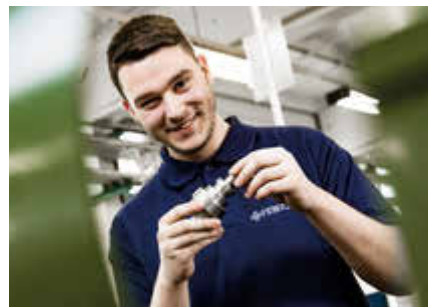
Maschinen- u. Anlagenführer/in (gn) Begeisterung für perfektes Handwerk