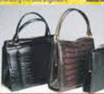
Wir zahlen bis zu 100,- für Designerhandtaschen