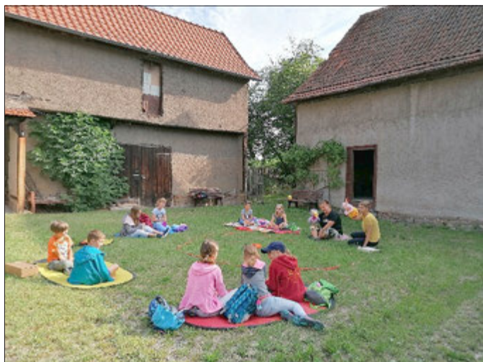
gez. Anette Denner

Dankbare Eltern, begeisterte Kinder und zufriedene Mitarbeiterinnen sind das Geschenk dieser spontanen Idee zu Ferienbeginn.